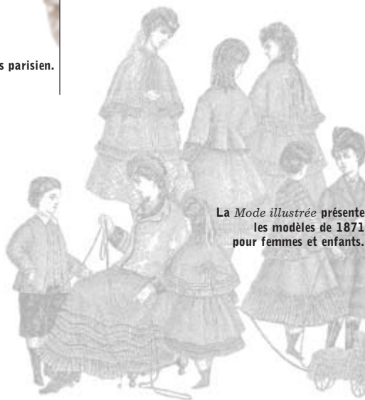
La Mode illustrée présente les modèles de 1871 pour femmes et enfants.