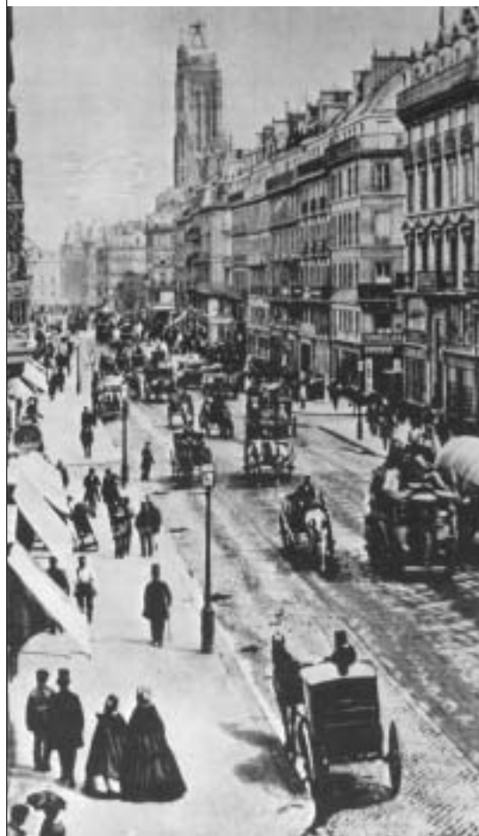
La rue de Rivoli à la fin des années 1860.