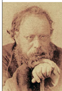
PIERRE-JOSEPH PROUDHON (1809-1865)

Théoricien socialiste, il est emprisonné pendant trente-six ans, notamment pour avoir mené une insurrection contre le gouvernement de Louis-Philippe. Cette longue détention lui vaut le surnom de « L'Enfermé ». Incarcéré de nouveau en 1870 pour s'être opposé à la guerre contre les Prussiens, il ne peut participer physiquement à la Commune de Paris mais y contribue largement par ses idées.