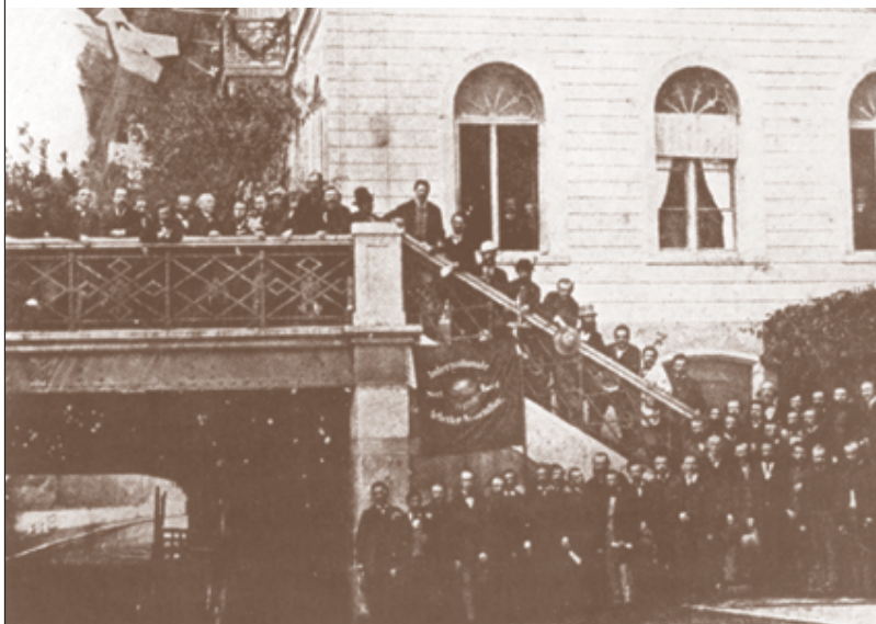
Les participants au congrès de l'Association Internationale des Travailleurs, à Bâle, en 1869

Le 28 septembre 1864, l'Association Internationale des Travailleurs est fondée à Londres. Ses statuts provisoires et son « Adresse inaugurale » sont partiellement rédigés par Karl Marx, théoricien de la lutte des classes. En France, l'Association Internationale des Travailleurs va fédérer deux mouvements ouvriers rivaux. D'un côté les proudhoniens qui prônent la mise en place d'un nouveau système économique, de l'autre les blanquistes qui donnent la priorité à la prise de pouvoir politique. À la fin du Second Empire, les idées de l'Internationale se propagent très rapidement dans la classe ouvrière et forment la conscience politique de futurs acteurs majeurs de la Commune de Paris, tels Eugène Varlin et Nathalie Le Mel.