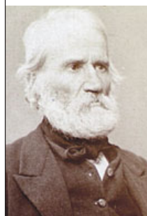
LOUIS-AUGUSTE BLANQUI (1805-1881)

Philosophe et économiste allemand, il est l'auteur du Capital , œuvre qui a posé les fondements du principe de la lutte des classes et de l'idéologie communiste. De Londres, où il dirige la première Internationale, il suit avec intérêt l'expérience de la Commune de Paris qu'il analysera dans La Guerre civile en France .