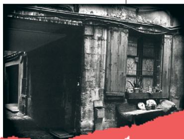
Premier siège du bureau parisien de l'Internationale au 44 rue des Gravilliers