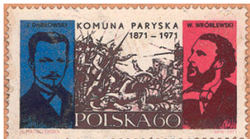
Centenaire de la Commune, timbre polonais.