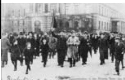
Révolution allemande, novembre 1918.

M ouvement emblématique de la lutte contre l'oppression, la Commune de Paris a inspiré au cours de l'Histoire d'autres soulèvements célèbres comme les révolutions bolchevique et spartakiste, ainsi que les Communes de Carthagène, de Canton, de Hongrie et des Asturies. Pendant la Guerre d'Espagne, un bataillon des Brigades internationales a porté fièrement son nom.