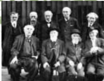
Les derniers communards au banquet du 18 mars 1929.