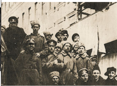
Révolution russe, 1917.