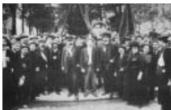
Manifestation au Père-Lachaise, 1911.