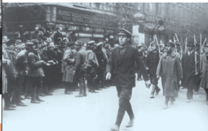
Révolution hongroise, 1919.