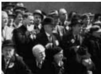
Le 24 mai 1936, le Front Populaire rend hommage à la Commune. Léon Blum est au centre (chapeau clair), Maurice Thorez à sa droite (tête nue), Marcel Cachin devant (chapeau mou noir).