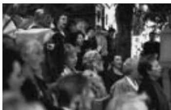
Manifestation au Père-Lachaise, 1996.