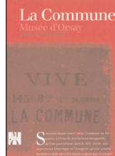
Exposition au Musée d'Orsay, 2000.