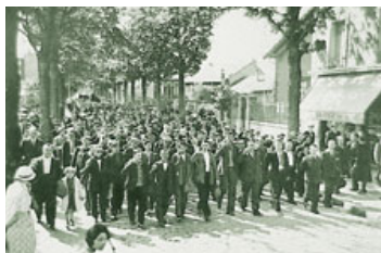
Anniversaire de la mort des communards au Moulin de Saquet à Vitry, 1934.